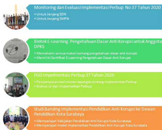
Gambar 1 : Tahapan Kegiatan DPKS dalam Mengawal Pendidikan Anti Korupsi